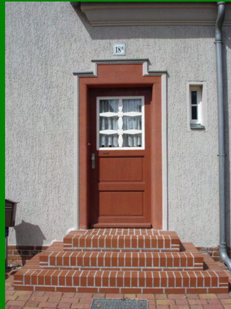
Hauseingang in der südlichen Gartenstraße

2.3.2.7 den gemauerten Stufenanlagen vor den Hauseingangstüren mit unterschiedlichen Formgebungen;