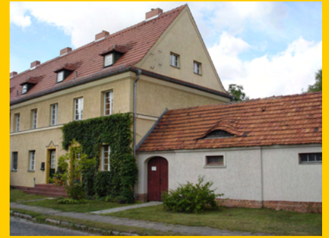
Reihenhaus mit Wirtschaftsgebäude in der südlichen Gartenstraße

Wirtschaftsgebäude, die, soweit sie an den Siedlungseingängen liegen, auch Torsituationen bilden, und schließlich auch von den Mauern überhaupt, die an Wirtschaftsgebäude anschließen und mit denen Hofbereiche abgegrenzt werden (Angaben von Geschosshöhen in diesem Abschnitt ohne Mitzählung von Dachgeschossen);