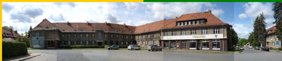
Bebauung am Karl-Liebknecht-Platz

dem zentralen Karl-Liebknecht-Platz, durch den die Hauptachse in parallelem Versatz hindurch läuft;