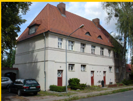
prägende Dachausbildung in der Breiten Straße

2.3.2.4 den Fensteröffnungen und Fenstern mit ihren charakteristischen Gestaltungsmerkmalen Format, Fenstergliederung, Kämpfer und Sprossen sowie ihren Profilen;